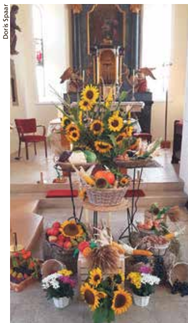
Am 17./18. September Bettag mit Erntedank in unseren Kirchen.