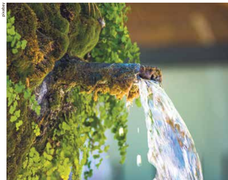
Wasser, ein Symbol für Leben und Reinheit.