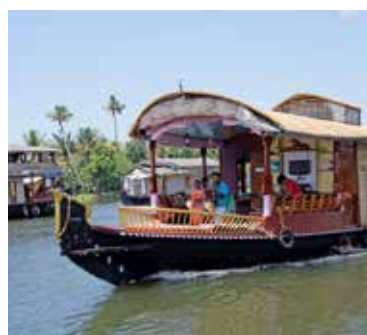
Hausboot auf den Backwaters.