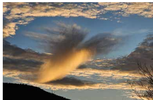
Text und Bild Elisabeth Borer

In diesem Sinne wünsche ich Ihnen allen alles Gute und Frieden im Neuen Jahr.