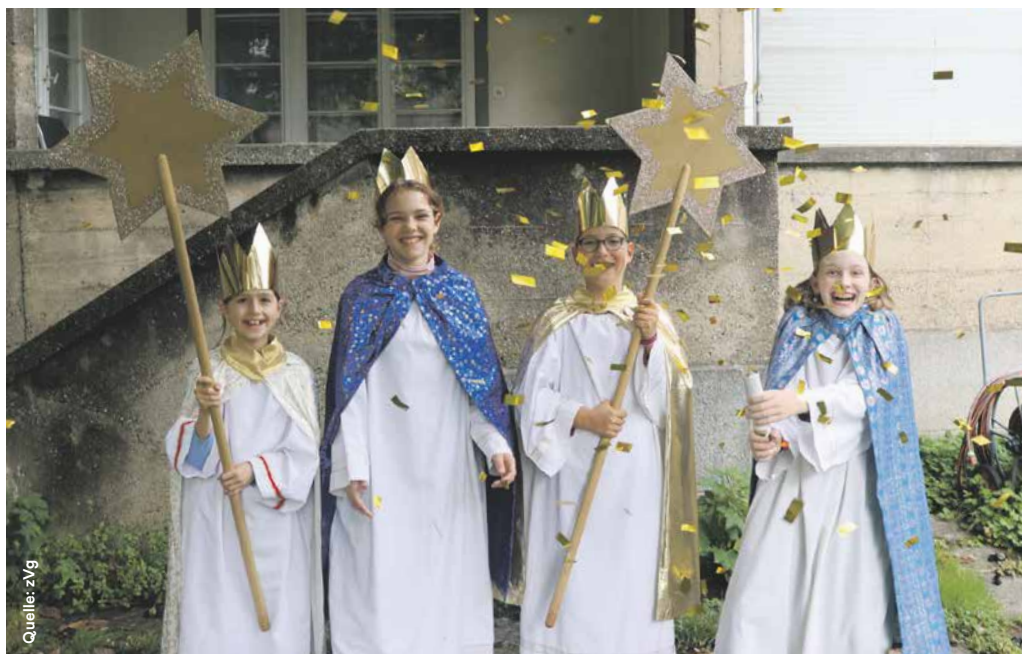
Am 28. Dezember geht es los: Die Sternsinger aus der Pfarrei St. Anton freuen sich auf ihre Reise nach Rom.

Ende November fand im Bildungshaus der Aargauer Landeskirche, der Propstei in Wislikofen, das Sternsingerforum statt. Aus verschiedenen Kantonen waren die Teilnehmenden angereist, um sich über den Brauch des Sternsingens auszutauschen, sich auf die Aktion Sternsingen 2025 vorzubereiten und Neues zu lernen. Sie alle sind in ihren Pfar-